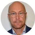
Moderator Thomas Krook Krishanteringskonsult Murphy Solution