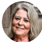
Speciellt inbjudna Camilla Waltersson Grönvall Socialtjänstminister Regeringskansliet