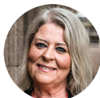
Speciellt inbjuden Camilla Waltersson Grönvall Socialtjänstminister Regeringskansliet